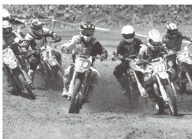
激しいバトルを見せた SE150