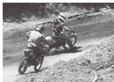
SE150の激しいトップ争い