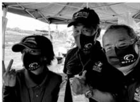
ALPHATHREE 様から役員用マスクをご提供いただきました

群馬県織笠村 / 純アライヘルメット / 純アールエス / タイチ / 南アルファスリー / 純イングラム・純ビート (NORTON) / WEST WOOD MX 純 / 東うず瀬レーシング / ウェストポイント / NGK 日本特殊陶業株 / 南 NUTEC Japan / 純MHプロダクト / 純協和調材 (Microbrn) / 純クシタニ東京 / 純JKA オートレース事業所 / 純SHOBI / 住友ゴム工業株 / 純ターゲットフリーフ / 月刊ターゲットスポーツ / 純テクニカルスチール / 純テクニクス / 東京スリーホークス / ナカネデザイン事務所 (Me&Her Racing) / 純プリヂェストン / 純フォトクリエイト / 純フォーシーズンズ / 純プライベートレーシング&ハニービー / Body Maintenance 3110 / PHOTO HUNTER / MY ROAD - II / 純メディアカルマネージメントサポート / 純ワークスワン (順不同)