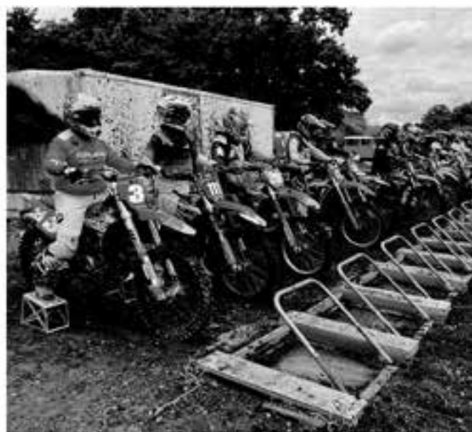
観客はやはり雨が濡らされてきた波乱のGP&SEクラス