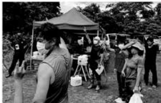
午前中のレースの表彰式終了後はお楽しみ会のじゃんけん大会