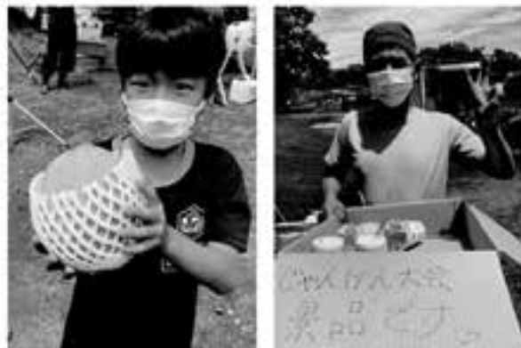
じゃんけん大会で見事高級メロンなどをゲット