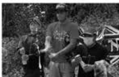
表彰式ではNorton ブランドウェアのプレゼント