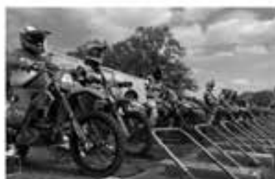
遠隔競選クラスのGP&amp;SE クラス

群馬県産肉村 / 株式会社ヘルメット / 株式会社アルニス タイチ / 株式会社アルファスリー / 株式会社イングラム・株式会社(NORTON) 株式会社ウエストウッド井原商会 / 株式会社レーシングウエストポイント / NGK 日本特殊陶業株式会社 / 株式会社NUTEC Japan / 株式会社MHプロダクト / 株式会社協和興材(Microton) / 住友ゴム工業株式会社 / 株式会社(月刊)ダートスポーツ / 株式会社テックニカルスチール / 株式会社テックニクス / 株式会社東京スリーホークス / 株式会社高システム / 株式会社プリヂストーン / 株式会社フォトルイト / 株式会社フォーシーズンズ / プライベートルレーシング & ハニービー / 北湖モーターサイクル / 株式会社ワークスワン / OFFICE CAMELIN / PHOTO HUNTER / 他 (順不同)