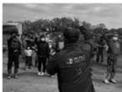
今回もじゃんけんあじさん大活躍