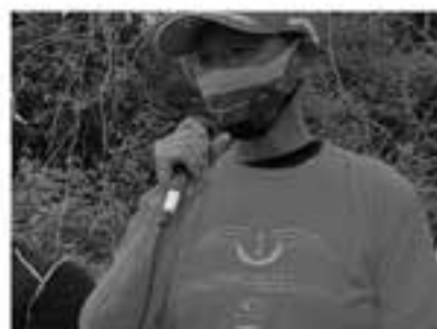
2022バージョンウィクトリーTシャツ初披露も優勝するともらえます。大会ごとき色変更。