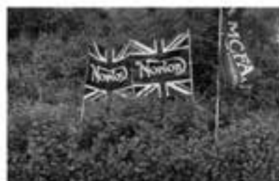
表彰台の後ろの、綺麗な花崗にバナー設置