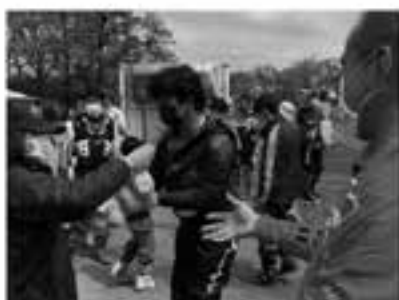
アド街で紹介された三郷で仕入れてきたイチゴ、はっさく、スポーツドリンク(薬) など大盛況