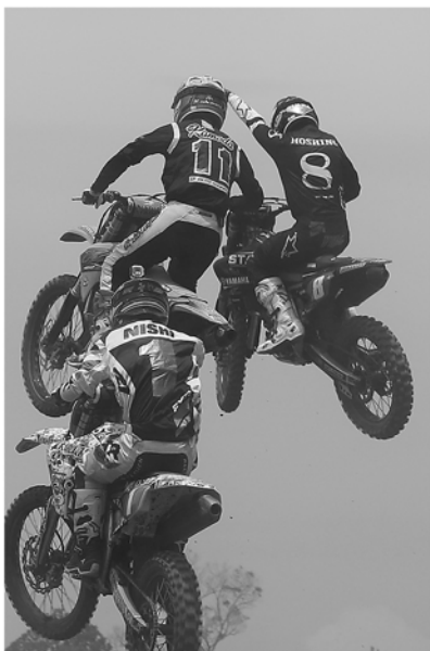
GP クラスをかき回してくれた地元 IA ライダーはさすがに速い

群馬県綿恋村 / ㈱アライヘルメット / ㈱アールエス タイチ / ㈱アルファスリー / ㈱イングラム・㈱ビート (NORTON) / ㈱ウエストウッド井原商会 / ㈱うず潮レーシング / ウェストポイント / NGK 日本特殊陶業㈱ / ㈱NUTEC Japan / ㈱MHプロダクツ / ㈱協和興材 (Microlon) / 住友ゴム工業㈱ / ㈱造形社 (月刊ダートスポーツ) / ㈱テクニカルスクール / ㈱テクニクス / 東京スリーホークス / ㈱日高システム / ㈱ブリヂストン / ㈱フォトクリエイト / ㈱フォーシーズンズ / プライベートレーシング & ハニービー / 北湘モーターサイクル / ㈱ワークスワン / OFFICE CAMELIN / PHOTO HUNTER / 他 (順不同)