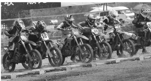
フルグリッドに近い台数で盛り上がったノービスフルサイズクラス