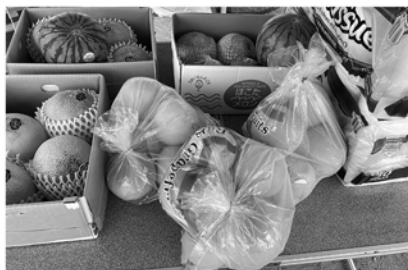
夏らしくスイカやメロンなどフルーツ盛りだくさん