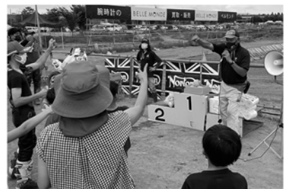
ジャンケン大会をメインに楽しむ方も、