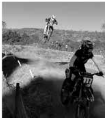
トップクラスのフィニッシュジャンプは空中戦のよう