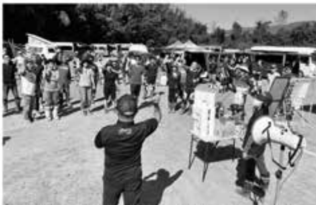
じゃんけん大会にはゴーグルやアンブレラ、そして地元産のサツマイモなど