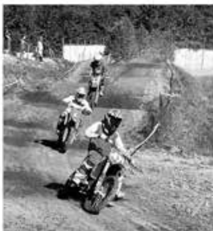
SE150は10代のライダーが大活躍