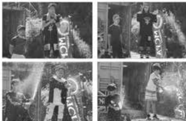
表彰式ではヴィクトリーTシャツの贈呈..そしてキッズもシャンペンシャワー