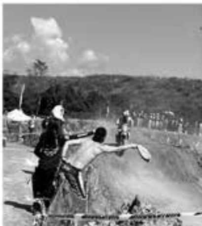
熱い走りに、応援にも熱が入る

㈱アライヘルメット / ㈱ブリヂストン / ㈱ダンロップタイヤ / ㈱テクニクス / ㈱イングラム・ ㈱ビート (NORTON) / ㈱ Westwood MX / ㈱アルファスリー / ㈱うず瀬レーシング ウエストポイント / ㈱アルエス タイチ / ㈱ NUTEC Japan / ㈱MHプロダクト ㈱協和興材 (Microclon) / ㈱通商社 / ㈱テクニカルスチール / 東京スリー ホークス / ㈱日高システム / ㈱フォトクリエイト / ㈱フォーシーズンズ / プライベート レーシング&ハニービー / 北港モーターサイクル / ZONE ENERGY / ㈱八重洲出版 ㈱ワークスワン / OFFICE CAMELIN / PHOTOHUNTER / Me&Her Racing / 他、 (順不同)