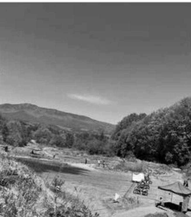
農山村の爽やかな風一そして快晴のベストコン!