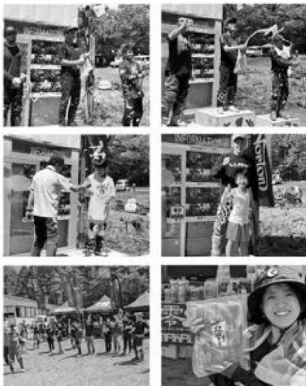
仲間に祝福される表彰式のあとは、みんな大好きジャンケン大会!