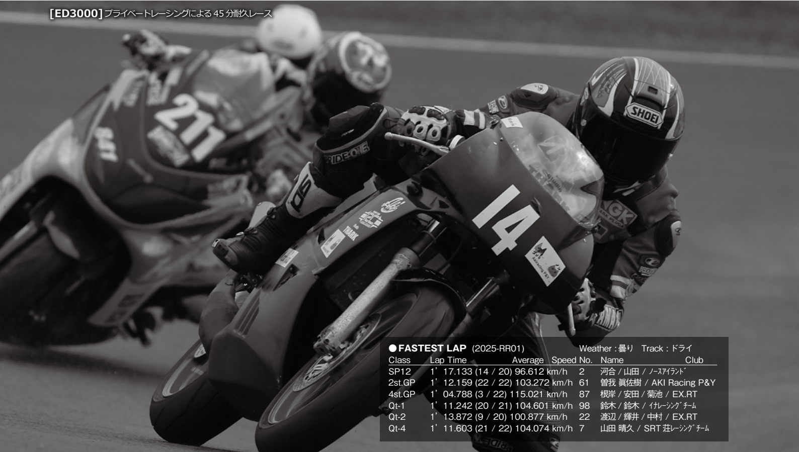
[ED3000] プライベートレーシングによる45分耐久レース