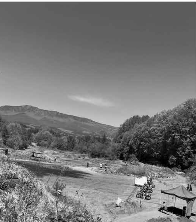
嬬恋村の爽やかな風～そして快晴のベスコン!

<協賛スポンサー各社様> 群馬県嬬恋村/ 株式会社ヘルメット/ 株式会社プリヂストン/ 株式会社ダンロップタイヤ/ 株式会社テクニクス/ 株式会社イングラム・株式会社ビート (NORTON) / 株式会社Westwood MX / 株式会社アルファスリー/ 株式会社うず瀬レーシング ウェストポイント/ 株式会社アルニス タイチ/ 株式会社NUTEC Japan / 株式会社MHプロダクツ/ 株式会社協和興材 (Microlon) / 株式会社造形社 / 株式会社テクニカルスチール/ 東京スリーホークス/ 株式会社高システム/ 株式会社フォトクワイエット/ 株式会社フォーシーズンズ/ EC Four / プライベートレーシング & ハニービー/ 株式会社アークスワン/ OFFICE CAMELIN / PHOTO HUNTER / Me&Her Racing / 他 (順不同)