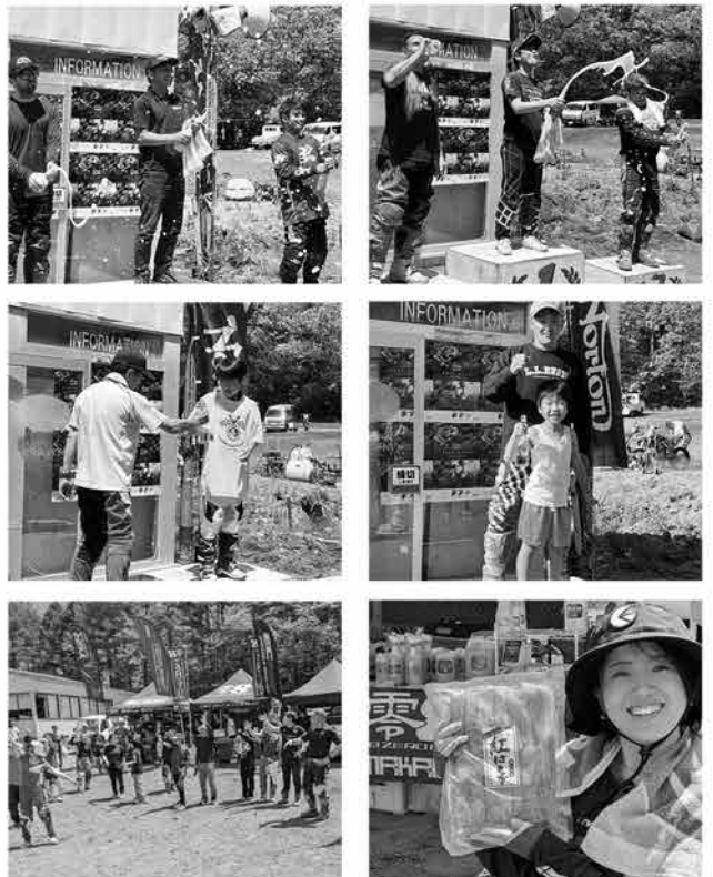
仲間に祝福される表彰式のあとは、みんな大好きジャンケン大会!